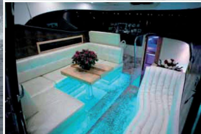
A sinistra la dinette e, qui sotto, la plancia di comando, con una comoda seduta per due persone. Gli interni sono completamente personalizzabili

L'organizzazione degli spazi sottocoperta prevede diversi layout. Quello standard è composto da una ▶▶