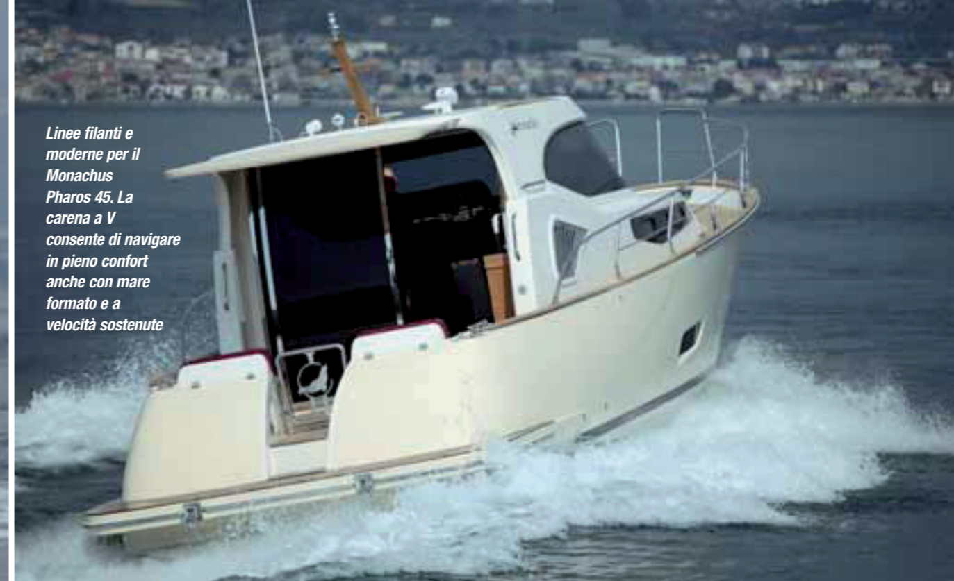
Linee filanti e moderne per il Monachus Pharos 45. La carena a V consente di navigare in pieno confort anche con mare formato e a velocità sostenute